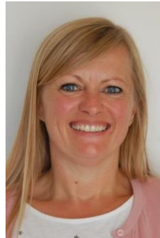
JUF KATHY Muzische opvoeding