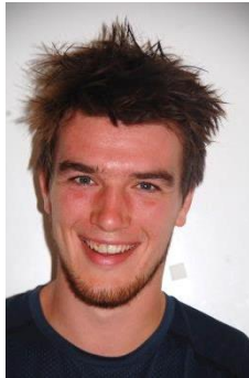
MEESTER SAM Bewegingsopvoeding